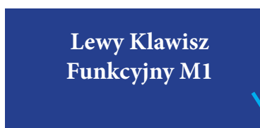
Lewy Klawisz Funkcyjny M1